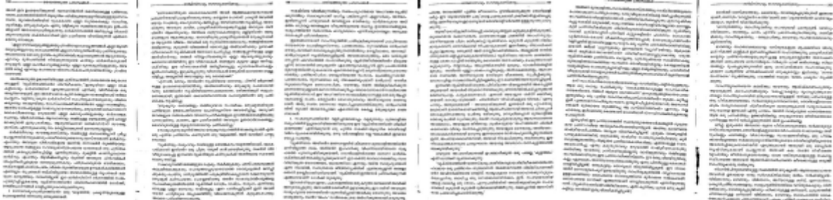
ഇനി 196-202 ( മാർക്സിസവും സമ സമര്യശാസ്ത്രവും എന്ന ലേഖനത്തിൽനിന്നുള്ള ഭാഗം)

272-275 പേജുകളിൽ ( മലയാള നിരൂപണത്തിൽ മാർക്സിസത്തിന്റെ സ്വാധീനം എന്ന പേരിലുള്ള ലേഖനത്തിൽ/പ്രഭാഷണത്തിൽ നിന്ന്) കാണുന്നത്: